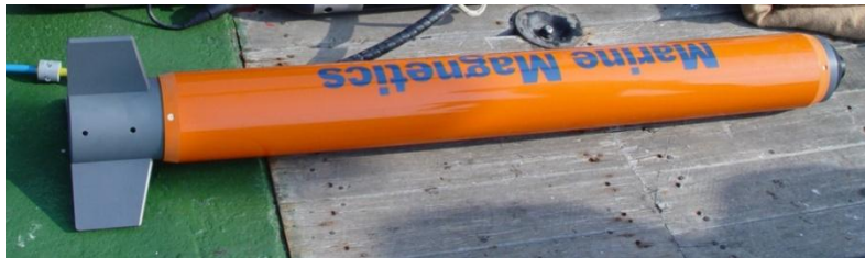
磁力儀儀器 Sea SPY